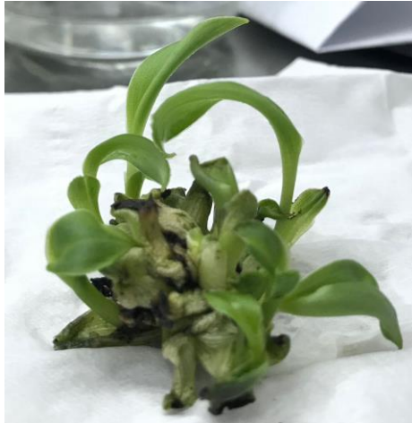
Gambar 1. Bentuk tunas embriosomatik fase globular pisang kepok tanjung dengan pemberian IAA dan BAP

Jumlah tunas nyata lebih banyak pada pemberian 1 mg/l IAA, relatif sama dengan pemberian 0,5 mg/l IAA dan berbeda nyata dengan 0 mg/l dan 1,5 mg/l IAA (Tabel 2). Hal ini diduga bahwa penambahan auksin eksogen mampu mempengaruhi keseimbangan auksin endogen dalam menstimulasi pertumbuhan sel pada eksplan. Menurut Davies (2013) dengan menempel pada reseptor yang telah berkembang pada membran sel dan kemudian memindahkan auksin dari ujung pucuk ke daerah pemanjangan sel, perlakuan auksin dapat mendorong perkembangan sel. Menurut Novianti et al. (2022), pisang barangan merah ( Musa acuminata Colla) menghasilkan tunas terbanyak yaitu 1,0 bila diberi 1 mg/l IAA.