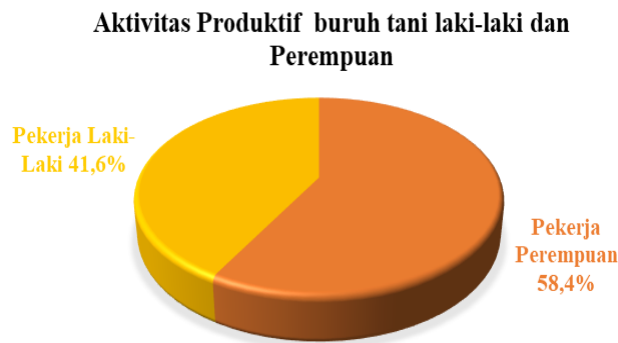
Gambar 3. Aktivitas Produktif Buruh Tani Laki-laki dan Perempuan

meliputi pengelolaan lahan, pembibitan dan perawatan bunga pacar air, itupun dilakukan tidak setiap hari. Pengelolaan lahan dikerjakan setiap 3 bulan sekali (setelah bunga pacar air dipanen semua), hal yang dilakukan diantaranya membuat bedengan dan membuat parit.