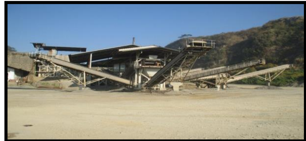
Gambar 2. Kegiatan Penambangan

menggunakan Hopper, Feeder, Jaw Crusher, Jaw Crusher ukuran kecil, Vertical Shaft Crusher, dan Belt Conveyor. Rangkaian peremukuan dapat dilihat pada (Gambar. 2)