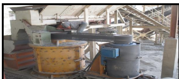
Gambar 3.3 (c)