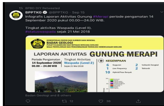
Gambar 1. BPBD DIY me-retweeted cuitan dari BPPTKG