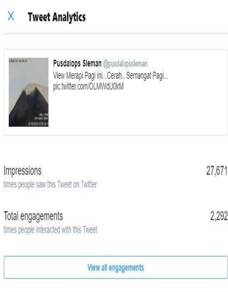
Gambar 2. Jumlah orang yang melihat postingan BPBD Gambar 3. Aplikasi Laporan Bencana Sleman