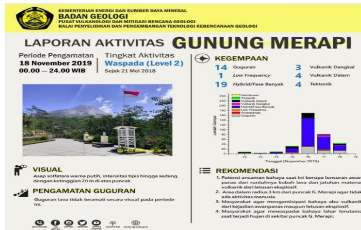
Gambar 3. Contoh Agenda Informasi “Laporan Aktivitas Gunung Merapi” yang diposting BPPTKG di akun twitternya