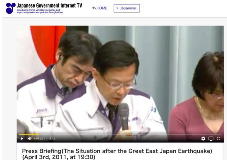
Gambar 5. Tampilan video yang diupload bulan April 2011 melaporkan keadaan pasca-bencana