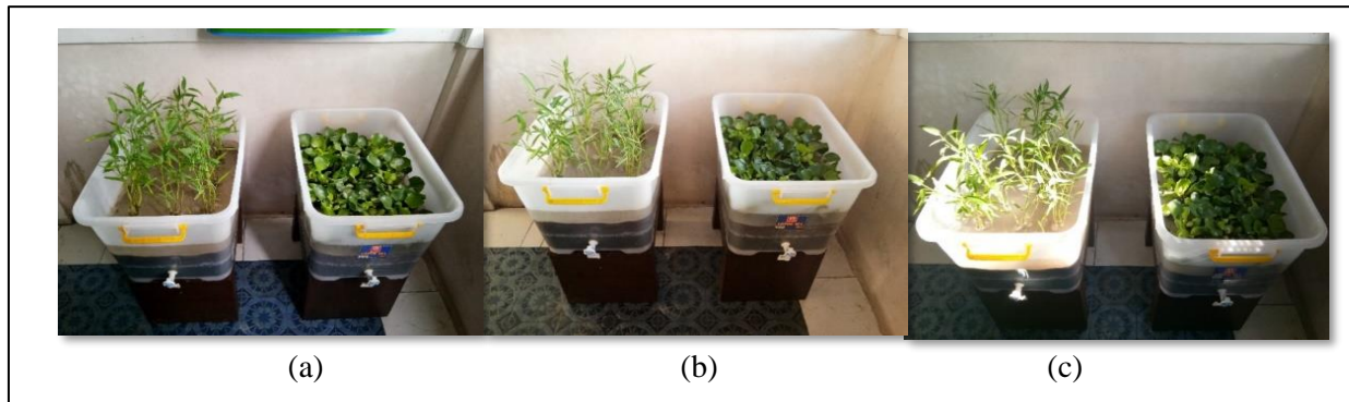
Gambar 3. (a) Waktu Tinggal 6 hari, (b) Waktu Tinggal 12 hari, (c) Waktu Tinggal 18 hari