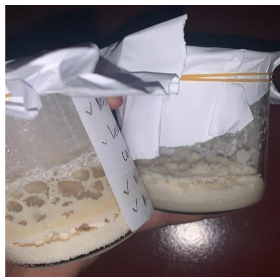
Gambar 2. Hasil produk dari rancangan SOP awal