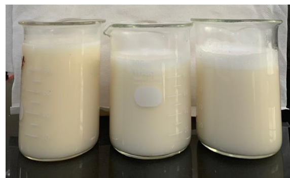
Gambar 5. Hasil produk dari rancangan SOP akhir