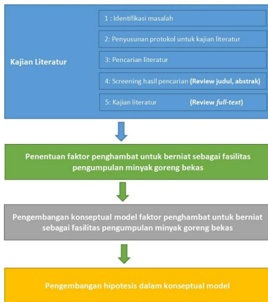
Gambar 1. Tahapan Penelitian