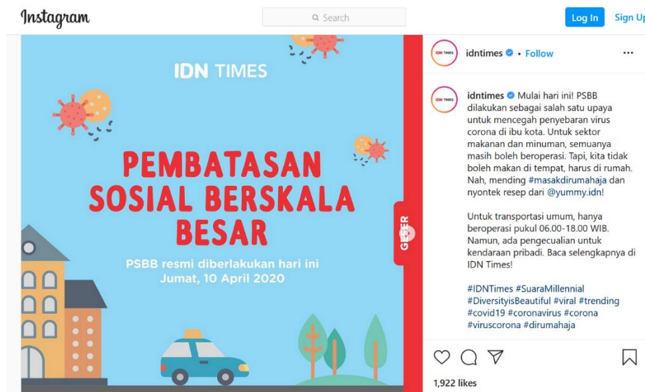
Gambar 3. Postingan instagram akun @IDNTimes 10 April 2020

Postingan pertama tentang PSBB pada akun instagram @IDNTimes yaitu dengan judul Pembatasan Sosial Berskala Besar resmi diberlakukan pada tanggal 10 April 2020. Akun instagram @IDNTimes memberitakan lewat postingan feed yaitu: