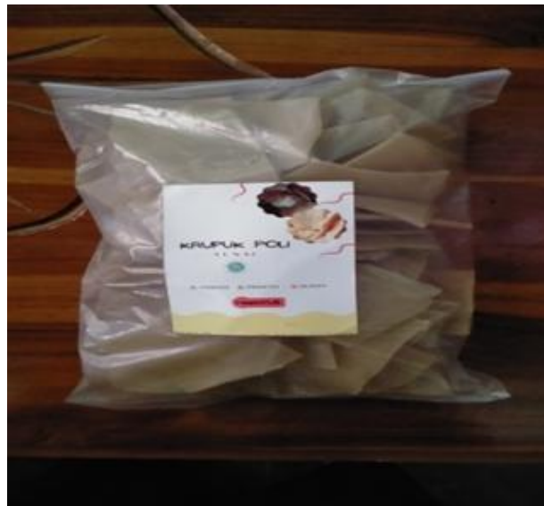
Gambar 3. Design label dan kemasan awal Produk UMKM