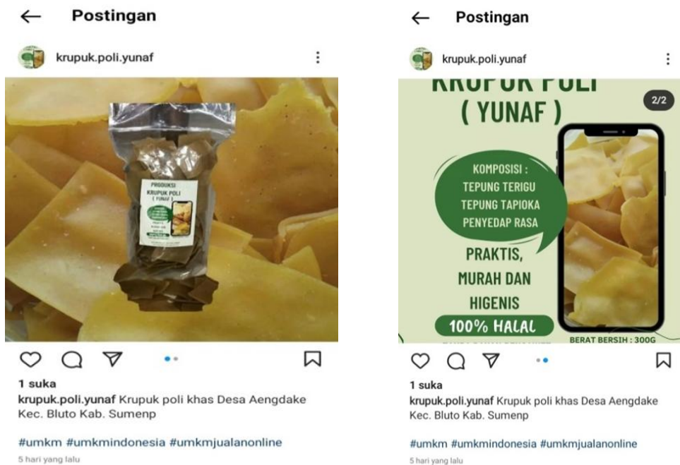
Gambar 8. Promosi Produk di Akun Instagram