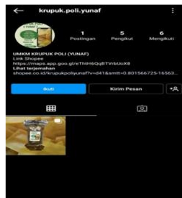
Gambar 6. Akun Instagram Kerupuk Poli Yunaf