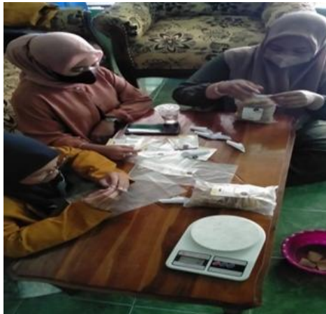
Gambar 1. Pelabelan hasil produksi

Tim pengabdian masyarakat melakukan pelatihan dan pembuatan desain label produk, pembuatan akun media digital, membuat dan melakukan promosi produk UMKM melalui market, bisa dengan memajang produk di media digital atau platform yang sudah ada seperti instagram, facebook, situs website, marketplace bahkan media youtube. hal ini diperlukan karena dengan media tersebut, maka produk UMKM yang akan dipromosikan ke berbagai tempat tanpa keliling menawarkan barang ke suatu tempat. Promosi pemasaran produk UMKM melalui media digital ini memberikan kemudahan bagi pemilik UMKM untuk semakin memperluas pemasaran dari produk UMKM tersebut.