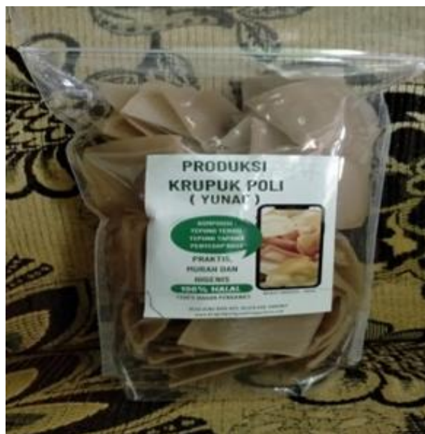
Gambar 4. Design label dan kemasan akhir Produk UMKM