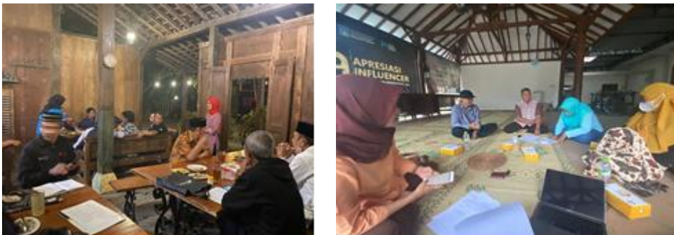
Gambar 1. Dokumentasi Kegiatan PbM UPN "Veteran" Yogyakarta

Pelaksanaan kegiatan pengabdian masyarakat dilaksanakan dalam beberapa tahap yaitu sosialisasi pemberian materi, pelaksanaan pengambilan foto dan video untuk destination branding dan fasilitasi pendaftaran merek dagang. Seluruh kegiatan dilaksanakan pada Desa Wisata dengan jumlah peserta 15 orang.