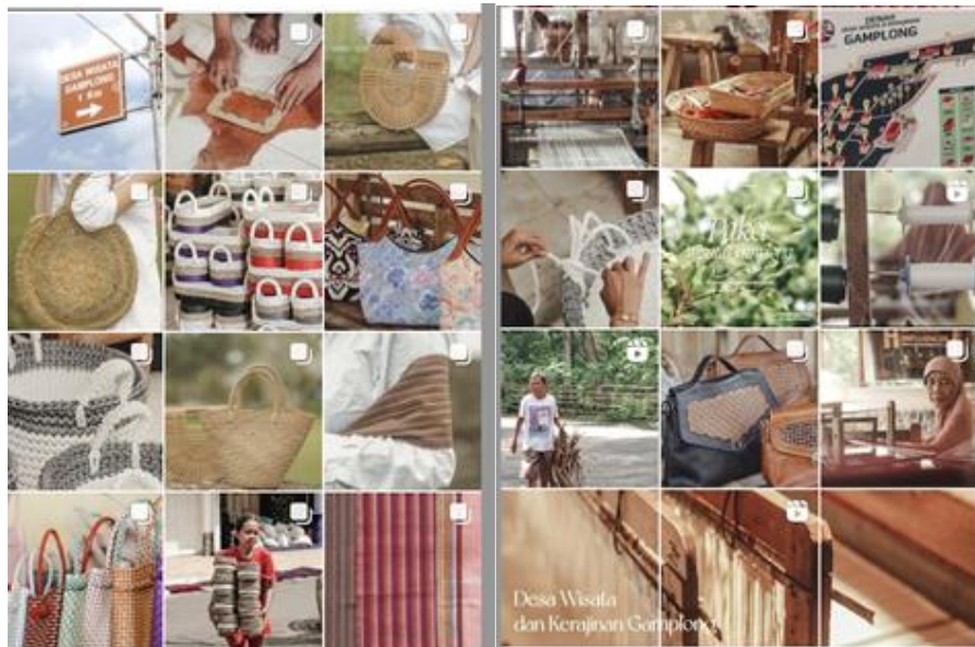
Gambar 3. Rebranding visual pada akun Instagram Desa Wisata Gampong

Sosial media Instagram dapat dijadikan media mempromosikan destination branding dari konten-konten yang bersifat visual. Sehingga diharapkan dengan mempromosikan dan membranding desa wisata gampong melalui media sosial media instagram akan menarik minat pengunjung wisatawan. Konten pada media sosial instagram meliputi informasi paket wisata, produk-produk kerajinan dari komunitas UMKM, masyarakat, budaya dan keindahan alam dari Desa Wisata Gampong.