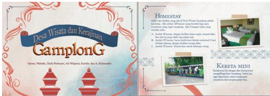
Gambar 6. Buku Profil Desa Wisata Gamplong