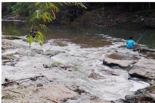
Gambar 4. Aktivitas Memancing di Perairan Sungai Opak oleh Masyarakat Sekitar

Hingga saat ini masyarakat sekitar masih mengonsumsi ikan-ikan dari Sungai Opak. Hal ini terlihat dari seringnya pemancing yang berada di sekitar perairan Sungai Opak. Kenampakan para pemancing di Sungai Opak pada titik sampling 4 ditunjukkan melalui Gambar 4 .