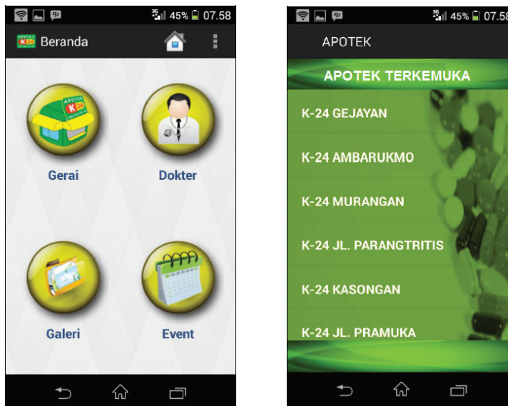
Gambar 2. Halaman Utama dan Daftar Apotek

Sistem diimplementasikan menggunakan pemrograman Java dalam platform sistem operasi smartphone Android. Sistem akan menampilkan persebaran sarana kesehatan misalnya sarana apotik, praktek dokter, poliklinik dan sebagainya.