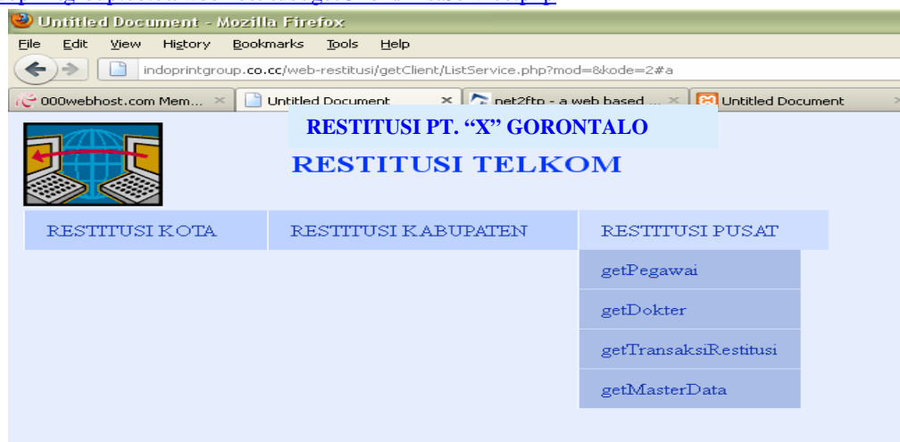
Gambar 4.1 Menu awal tampilan Web Service

Menu getPegawai untuk memanggil tabel dipegawai, getDokter untuk memanggil data tabel dokter, dan getTransaksiRestitusi untuk memanggil data di tabel transaksi. Untuk menampilkan form ini pada alamat url: http://indoprintgroup.co.cc/web-restitusi/getClient/ListService.php