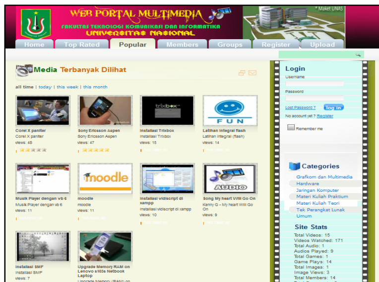
Gambar 3. Tampilan Media yang banyak dilihat oleh Pengunjung