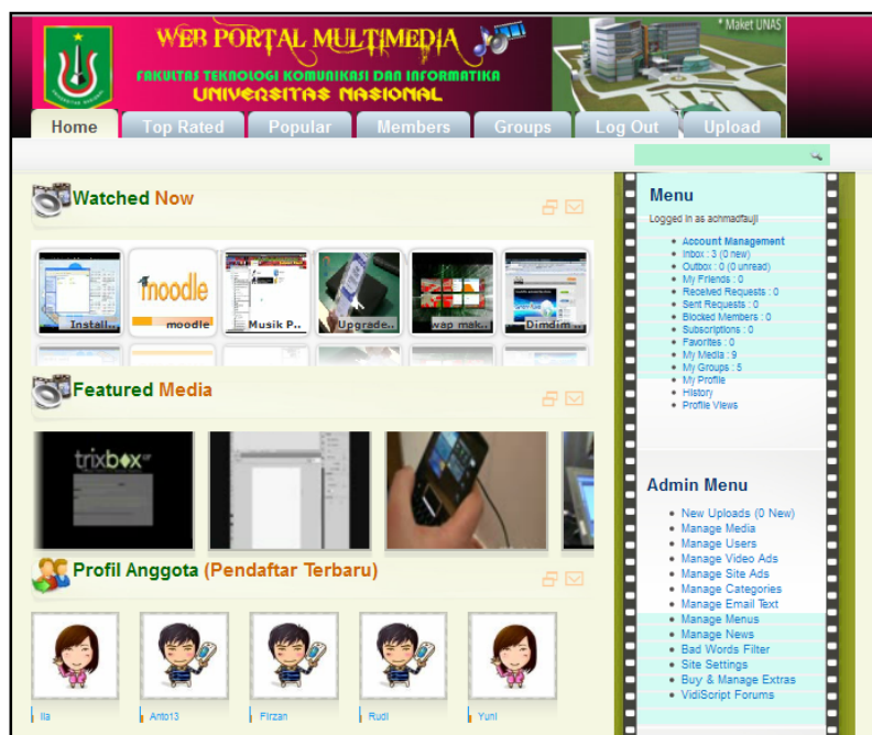
Gambar 2. Tampilan Home Web Portal