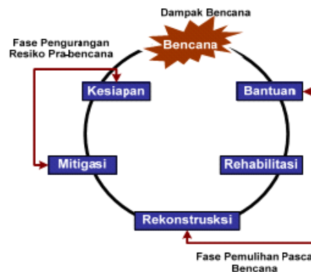
Gambar 1 Phase Bencana