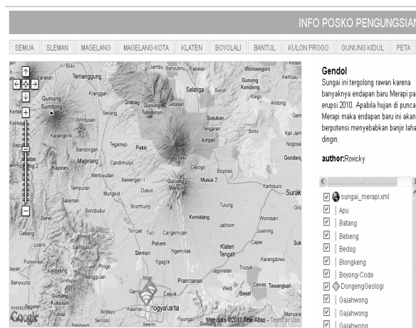
Gambar 3 GoogleMaps Info Posko Pengungsian SIMLOG-PB

Akuisisi basis data merupakan aktivitas pengkonversian data spasial (peta) dan data atribut manajemen logistik penanggulangan bencana yang masih berupa data analog kedalam format digital. Data atribut manajemen logistik penanggulangan bencana tersebut diklasifikasikan, diolah, dan diotomasi dengan pemberian identitas (ID) menggunakan SQL. Selanjutnya dilakukan pengintegrasian data atribut ke dalam peta digital dengan bantuan perangkat lunak pengolah data spasial yang mempunyai fasilitas pertukaran data secara dinamis melalui container OLE maupun driver ODBC, misalnya ArcView, AutoCAD Map, atau MapInfo.