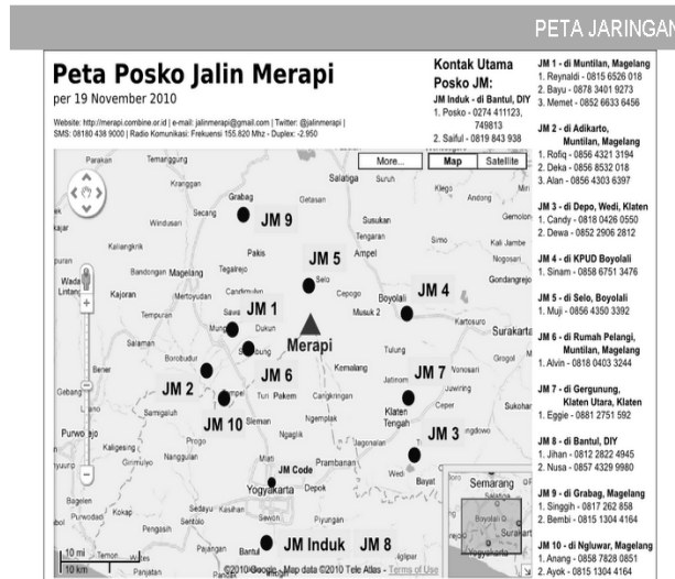
Gambar 4 GoogleMaps Peta Posko Jalin Merapi SIMLOG-PB

bencana. Salah satu cara yang dapat ditempuh agar basisdata tersebut dapat tersebar luas, maka basisdata tersebut harus dipublikasikan secara luas di internet, untuk itu harus dilakukan langkah terakhir yaitu transformasi basisdata (terutama peta dan rute transportasi yang dapat dilalui) kedalam bentuk interaktif yang berbasis web dengan perangkat lunak internet mapping yang dibantu dengan perangkat lunak JAVA.