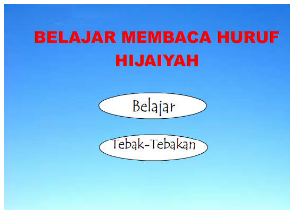
Gambar 3. Tampilan Halaman Utama

Menu Belajar berisikan tentang huruf-huruf hijaiyah. Tampilan menu belajar ditampilkan dalam Gambar 4. Dalam menu huruf ini setiap huruf ketika di klik akan menjadi besar disertai dengan suara pengucapannya.