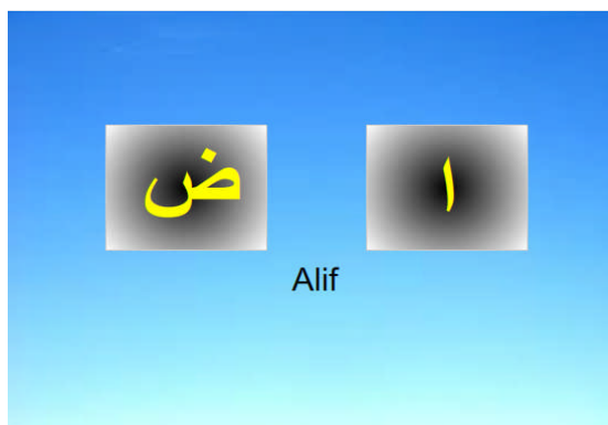
Gambar 5. Tampilah Menu Tebak-tebakan tingkat 2

Menu Tebak-tebakan mempunyai 2 (dua) tingkat, tingkat pertama memiliki 2 pilihan sedangkan untuk tingkat kedua memiliki 3 pilihan yang salah satu pilihan tersebut ada yang benar. Tampilan menu belajar ditampilkan dalam Gambar 5 dan Gambar 6 .