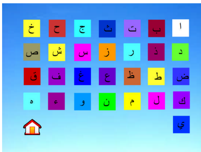
Gambar 4. Tampilan menu belajar

Menu Belajar berisikan tentang huruf-huruf hijaiyah. Tampilan menu belajar ditampilkan dalam Gambar 4. Dalam menu huruf ini setiap huruf ketika di klik akan menjadi besar disertai dengan suara pengucapannya.