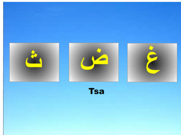
Gambar 6. Tampilan Menu Tebak-tebakan tingkat 3

Setelah program tersebut diujicobakan pada guru-guru di TPA-KB-TK Islam Ratnaningsih, maka secara keseluruhan media pembelajaran tersebut sudah sesuai dengan kurikulum yang ada. Tampilan menu belajar huruf hijaiyah yang berwarna warni membuat anak-anak akan senang belajar huruf hijaiyah. Selain itu untuk anak usia 2-3 latihan tebak-tebakan dengan 2 pilihan huruf dan 3 pilhan huruf sudah cukup sebagai latihan baik dari sisi menghafal huruf maupun dari sisi motorik anak.