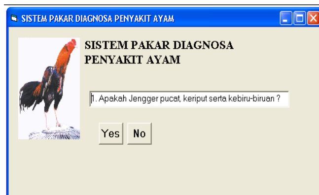
Gambar 4.1 Form Konsultasi

Gambar 4.1 menampilkan form konsultasi sistem. Pengguna cukup menjawabnya dengan mengatakan Yes atau No , bisa juga dengan menekan tombol Yes atau No . Sedangkan Gambar 4.2 menunjukkan hasil diagnosa dan saran cara pengobatannya.