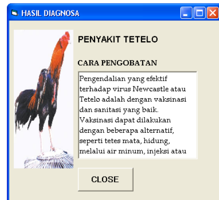
Gambar 4.2 Hasil Diagnosa